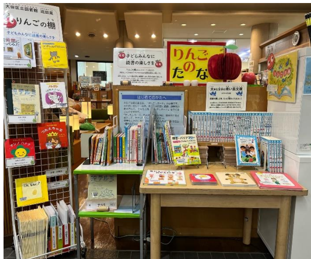
(羽田図書館の巡回展示の様子) 8月

「本を読む方法は一つではない」ことをたくさんの人たちに知ってもらうことを目的として、大田区立図書館全館で巡回して「りんごの棚」を展示しています。